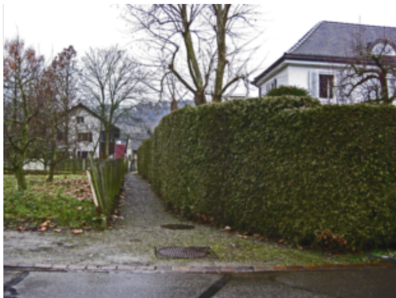
▼ Der «Unholzweg» in Embrach