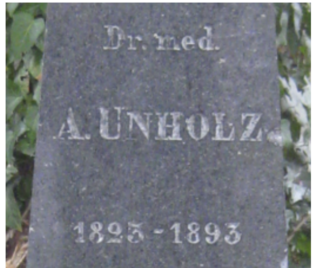
◀▲ Grabobelisk auf dem Friedhof